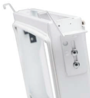
Luftdon utan renslucka