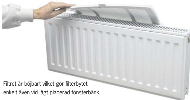
Filtret är böjbart vilket gör filterbytet enkelt även vid lågt placerad fönsterbänk