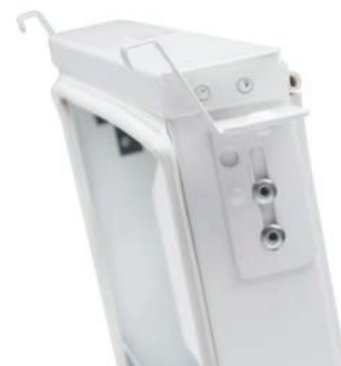
Luftdon med renslucka