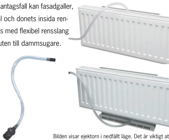
Bilden visar ejektorn i nedfällt läge. Det är viktigt att ejektorn efter rensning viks upp till uppfällt läge

Easy-Vent kan vid behov torkas av med lätt fuktad trasa. Förutom regelbundna filterbyten krävs normalt ingen ytterligare rengöring. I undantagsfall kan fasadgaller, kanal och donets insida rengöras med flexibel rensslang ansluten till dammsugare.